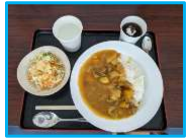
カレーライス、なんでも千切りサラダ、ゼリー（コーヒー・ぶどう）

地域食堂「Yell Kitchen」は、会場を1階へと移し、開かれた空間でどなたでも入りやすいかたちにしたことで、サークル終わりの方や、個人学習でご利用の方の参加ももちろんのことですが、普段えるるを利用されていない方の参加も見られるようになりました。回を追うごとに新しく来ていただく方が増えています。えるる建物内1階にある社協さん運営の「つどいの広場（小さいお子さんと保護者が集う広場）」を初めて利用された方も「Yell Kitchen」が開催中の所を見かけられて、参加されたとのことでした。